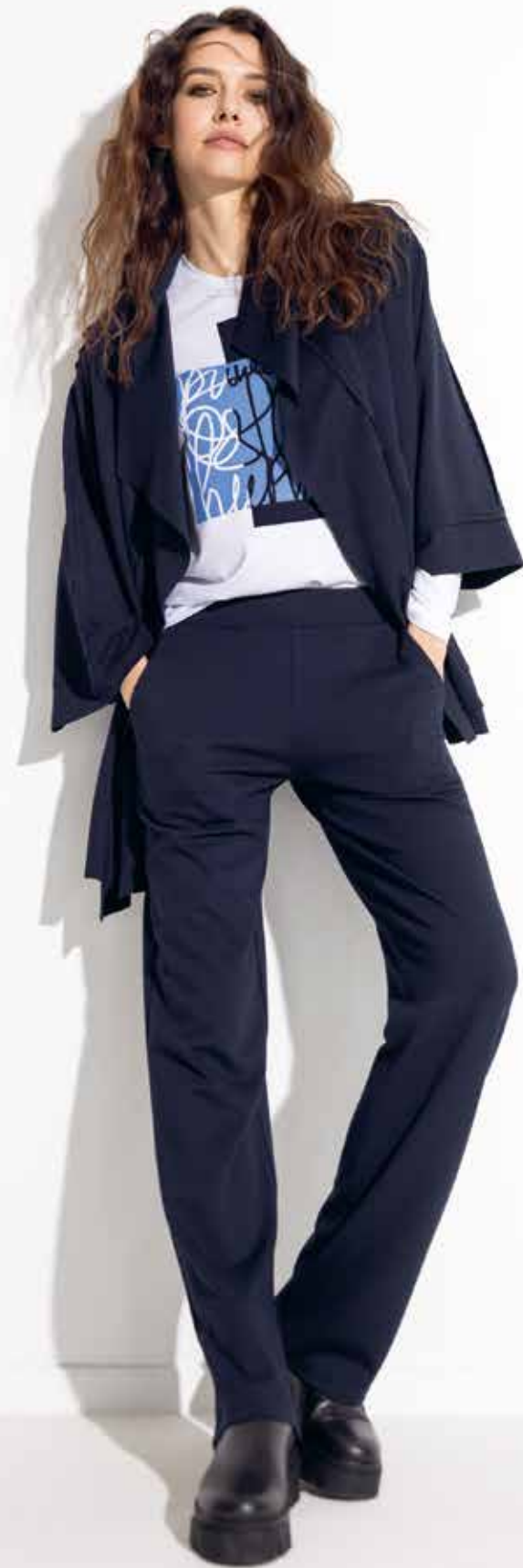
458 085 092 - Jacke 452 244 092 - Shirt 458 086 092 - Hose 450 108 901 - Stiefeletten