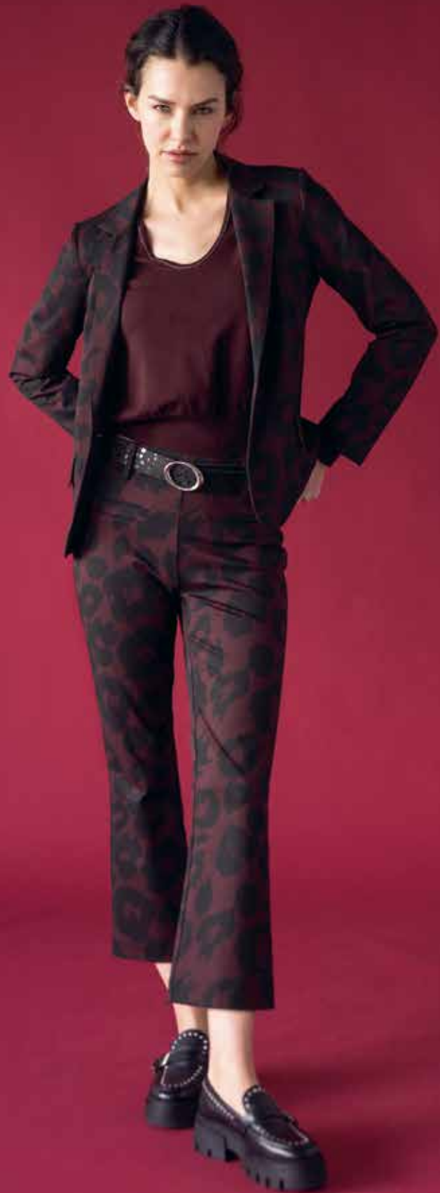
Blazer - 458 033 081 Pullover - 451 013 081 Hose - 458 034 081 Loafer - 450 104 901 Gürtel - 450 303 901