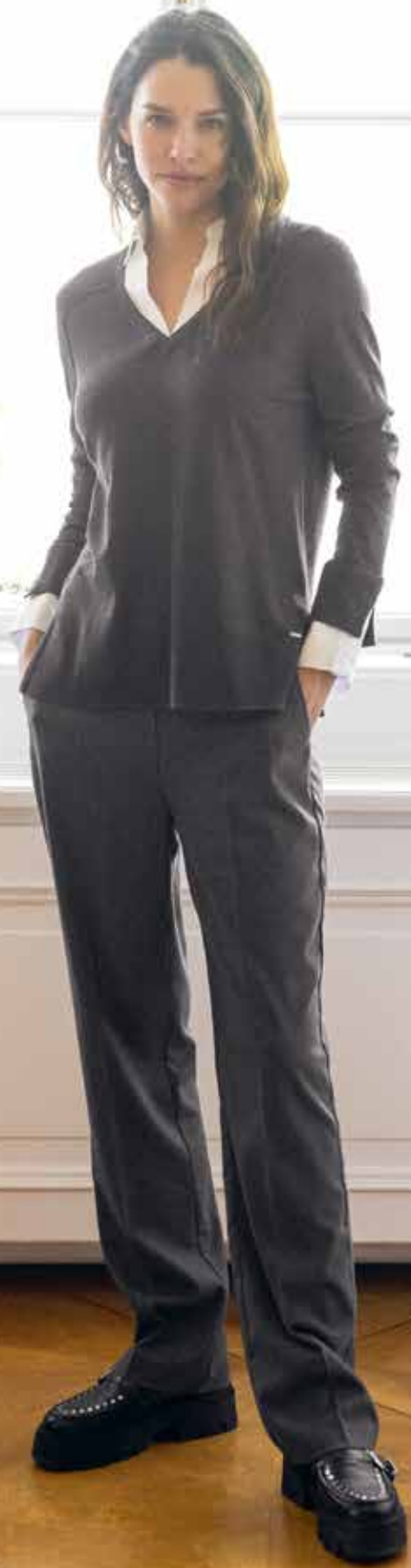
Pullover - 451 022 082 Hose - 458 049 082 Loafer - 450 104 901