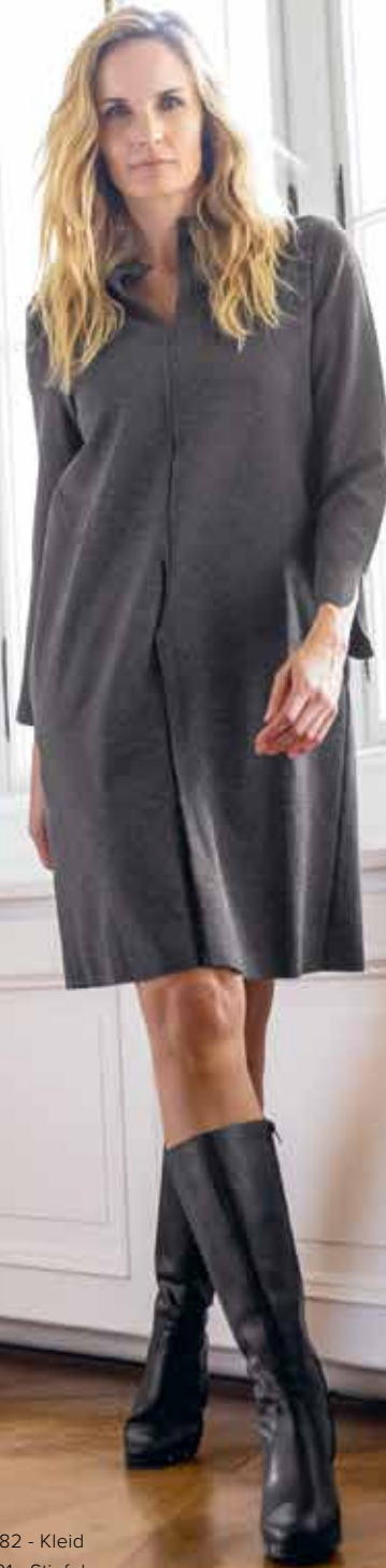
458 065 082 - Kleid 450 102 901 - Stiefel