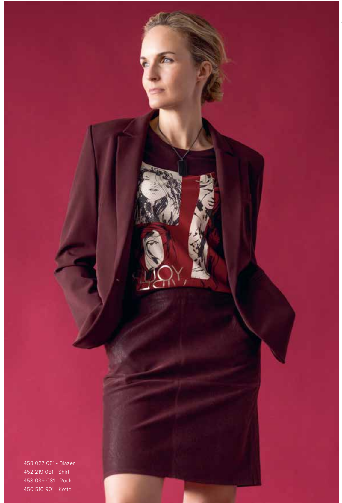
458 027 081 - Blazer 452 219 081 - Shirt 458 039 081 - Rock 450 510 901 - Kette