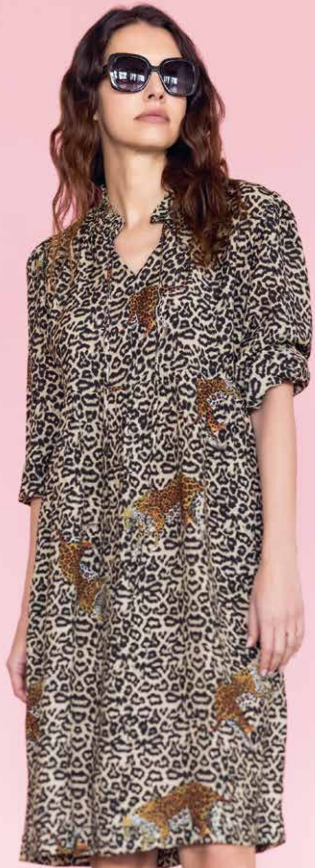
S.8: Kleid - 456 612 071 S.9: Bluse - 456 611 071 Jeans - 454 007 071 Sneaker - 450 106 901