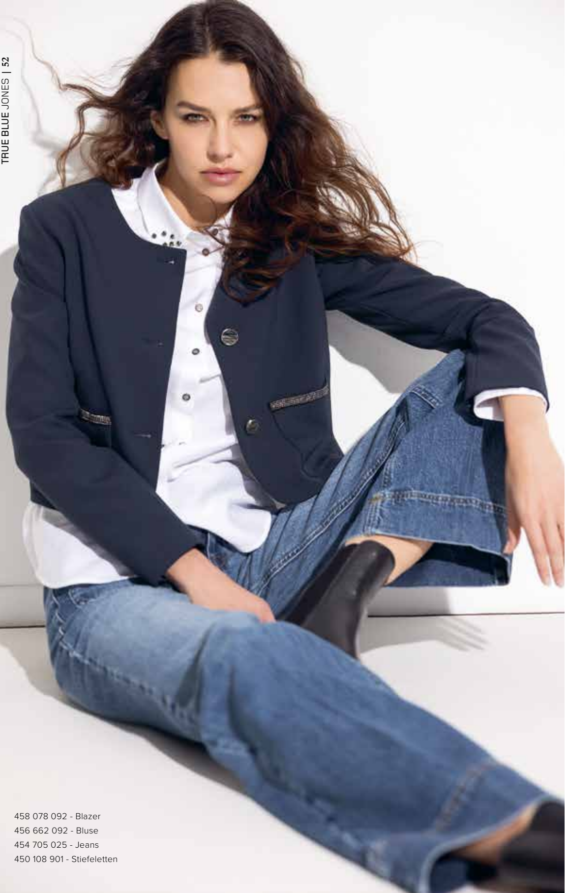
458 078 092 - Blazer 456 662 092 - Bluse 454 705 025 - Jeans 450 108 901 - Stiefeletten