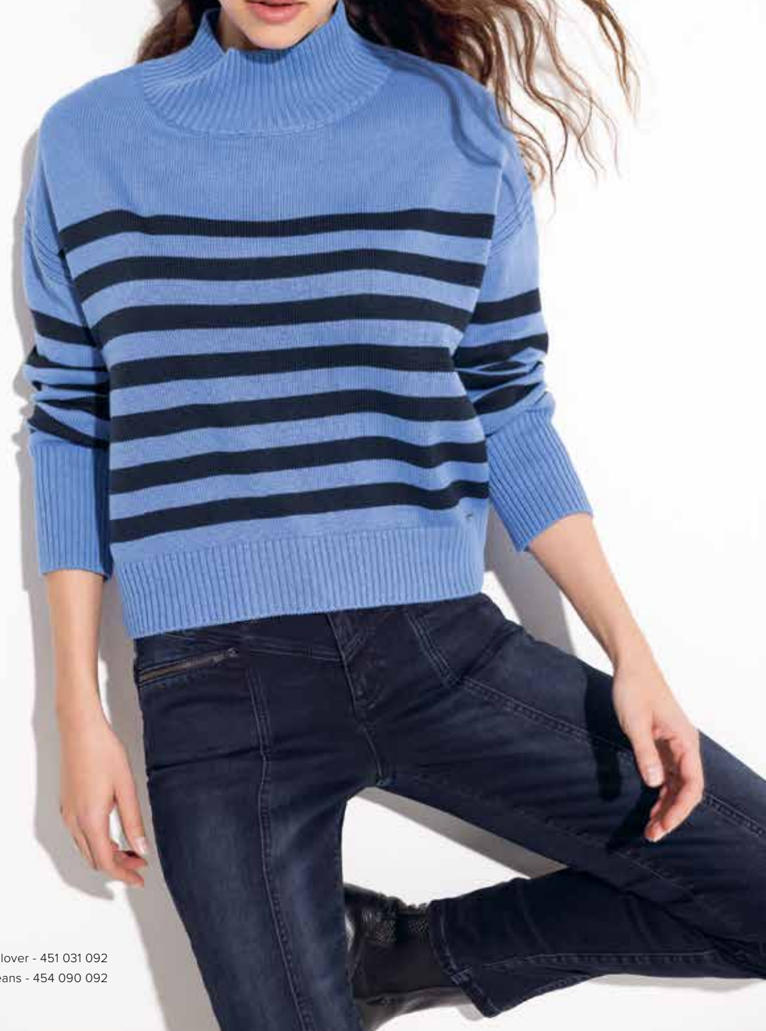
Pullover - 451 031 092 Jeans - 454 090 092