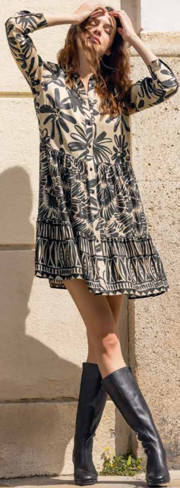
Kleid - 456 673 101 Stiefel - 450 102 901